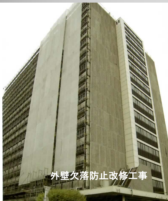
外壁欠落防止改修工事